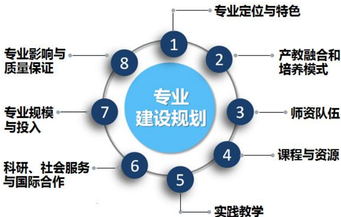
专业年度建设任务设计

结合专业建设方案中 2019 年建设任务，对专业定位与特色、产教融合与培养模式、师资队伍、课程与资源、实践教学、科研社会服务与国际合作、专业规模与投入、专业影响与质量保证 8 个专业建设要素进行整体设计。